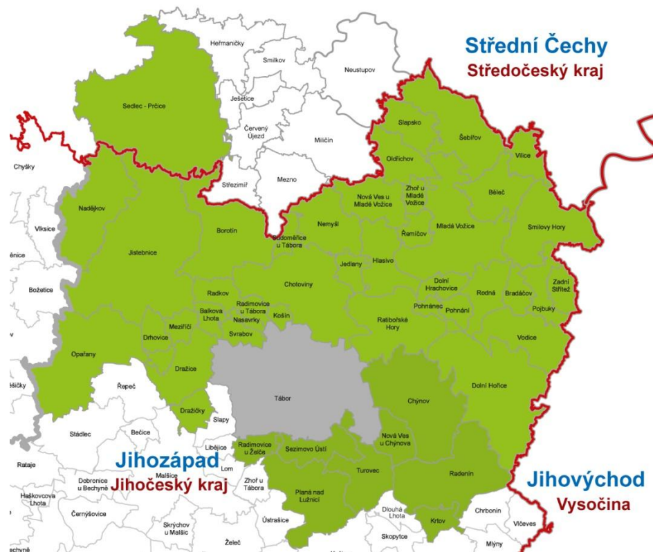
Obrázek 1 Území působnosti MAS Krajina srdce v kontextu regionů NUTS2 a NUTS3