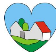
Tabulka 6: Aktivita, které MAS Krajina srdce podporuje v letech 2016 – 2023